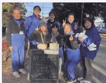
ふれあいの丘青少年指導員の皆さん