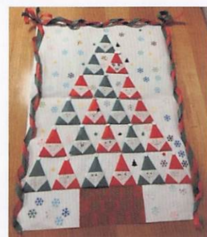
キッズクラブからの贈り物