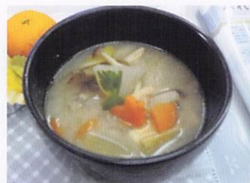
荇田南三丁目の“おふくろの味”