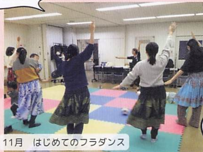
11月 はじめてのフラダンス

ママのためのフラダンス。 先生の楽しい話術と、ゆったり 体を動かすフラダンスで、笑顔 いっぱいの時間でした。