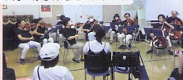
9月 はじめてのコンサート

子どもが泣いても 大丈夫と言われ、安心して 久しぶりにコンサートに参加 できました。